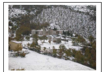
Civitella – Il Castello