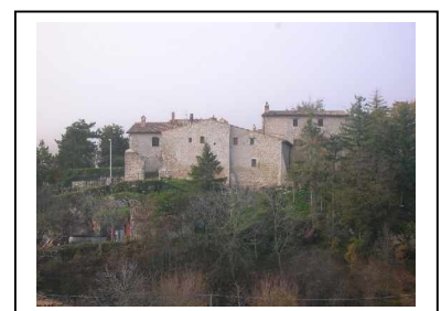
Morro – Il Castello