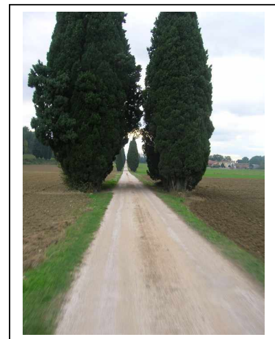
Vescia– Podere Navello