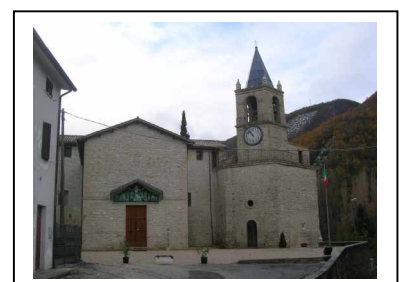
Scopoli – La Canonica e il Castello